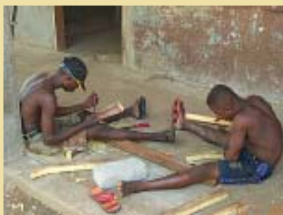
RITORNO ALLA VITA Ex bambini soldato della Sierra Leone al lavoro in un centro Caritas.