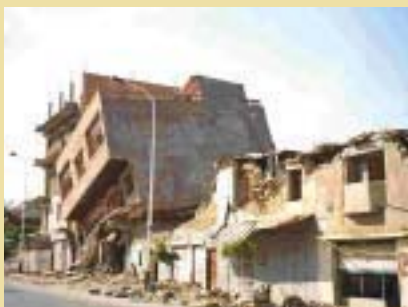
IL SISMA DOPO IL CONFLITTO Un terremoto ha devastato l'Algeria nel 2003: un duro colpo ai tentativi di ripresa dopo un decennio di violenze.

rosi); il progressivo smantellamento dello stato sociale; l'aumento della disoccupazione e la mancanza di alloggi: fattori che non possono essere ottusamente disgiunti dal reclutamento di forze da parte del Gia (Gruppo islamico armato) e del Fis. Il massacro di 300 persone, barbaramente sgozzate e trucidate in una piccola località a sud di Algeri, considerato l'atto più violento perpetrato dai guerriglieri islamici dopo l'annullamento delle elezioni del '91, non a caso avvenne proprio nell'agosto '97, pochi mesi dopo le decisioni governative conformi al volere dell'Fmi.